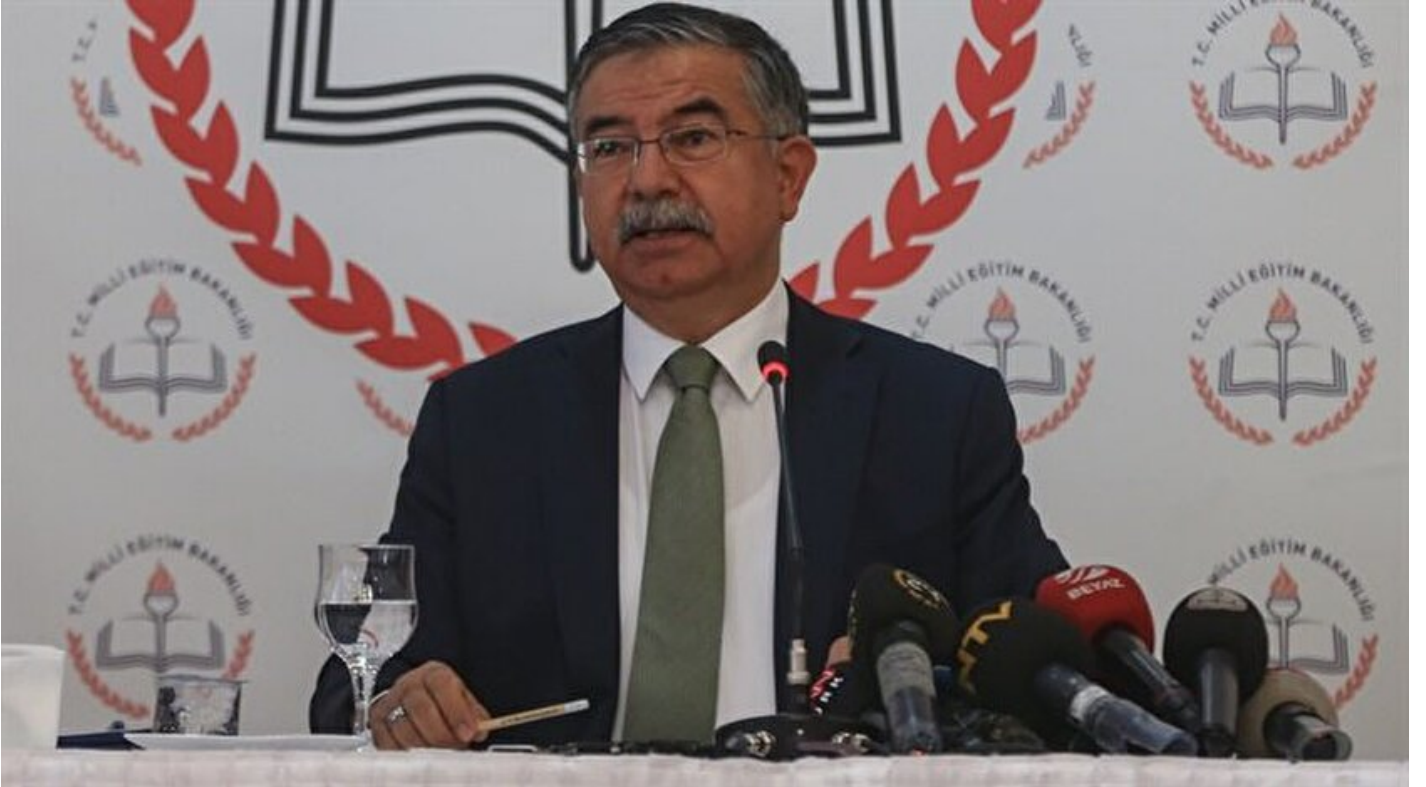
Milli Eğitim Bakanı İsmet Yılmaz

Haber Merkezi · 24 Ekim 2016, 16:58 · Son Güncelleme: 24 Ekim 2016, 17:11 · IHA