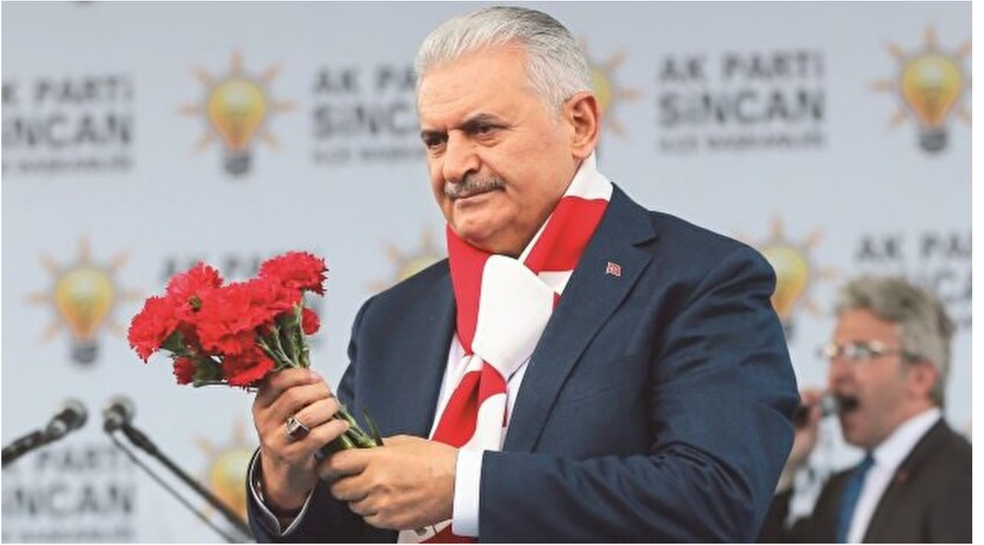
Başbakan Binali Yıldırım