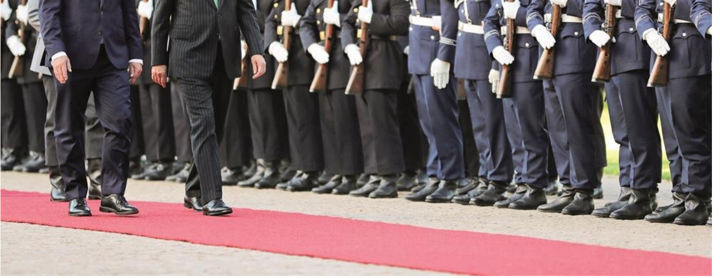
Frank Walter Steinmeier