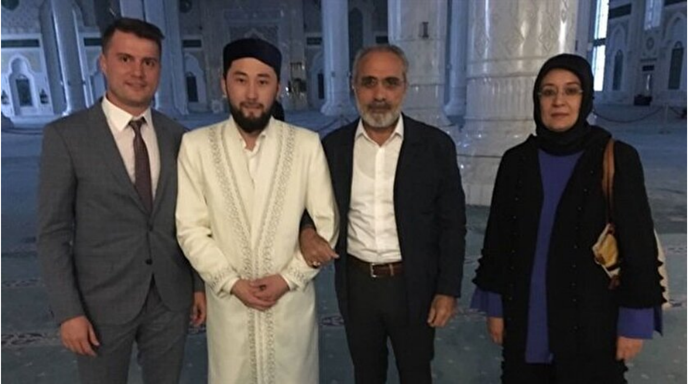
Cumhurbaşkanı Başdanışmanı Yalçın Topçu