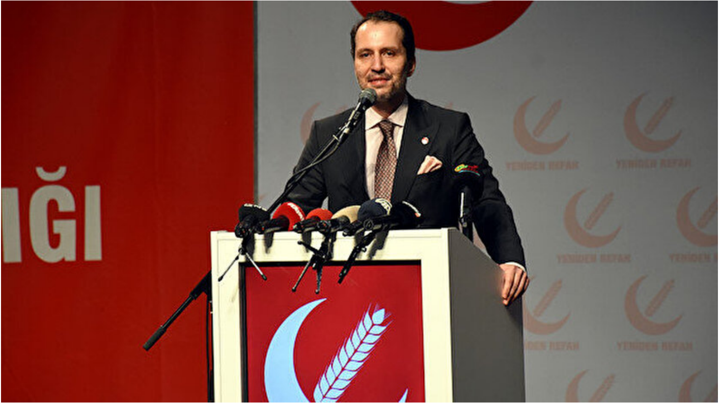
Yeniden Refah Partisi Genel Başkanı Fatih Erbakan.