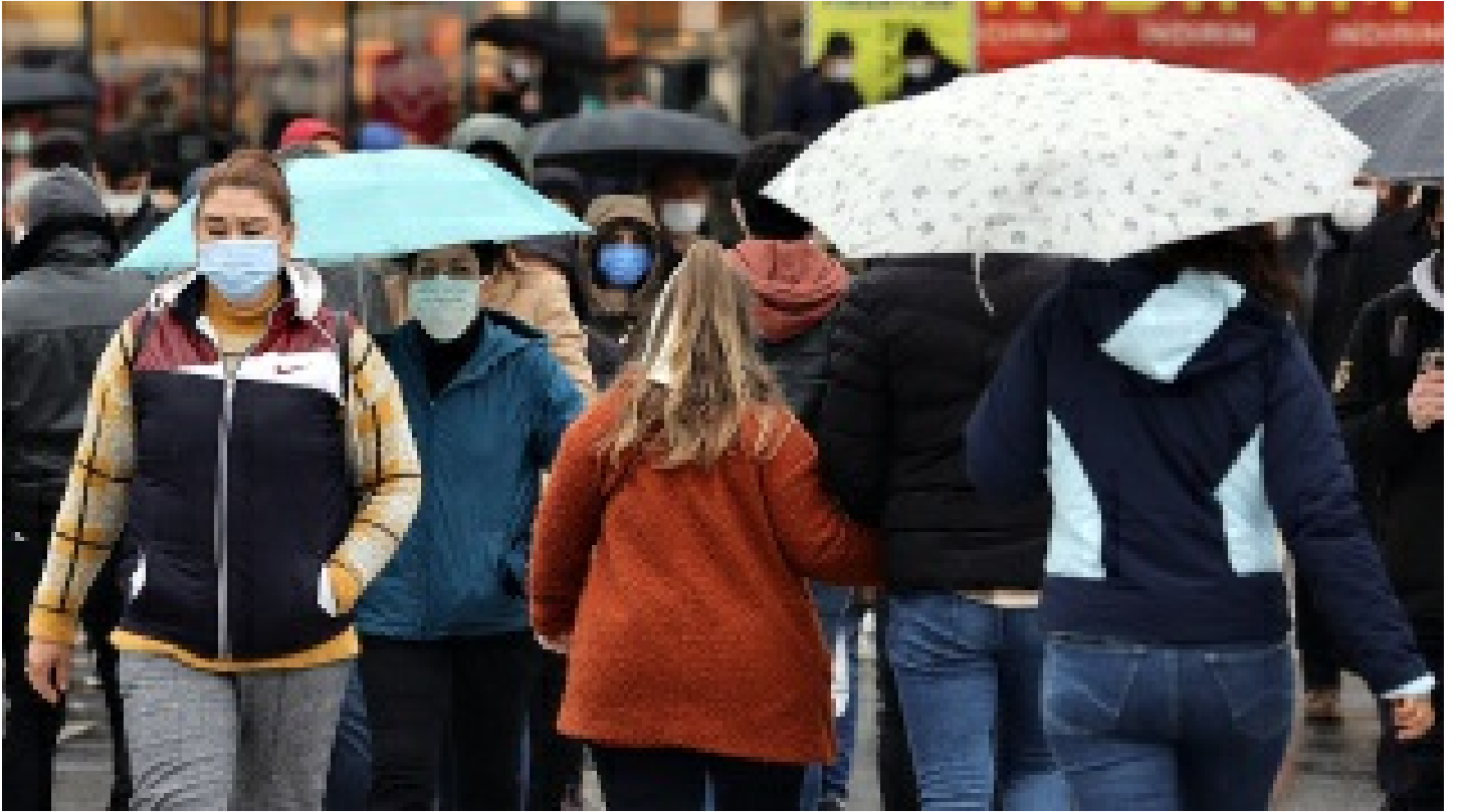
Mesafe yoksa açık alanda da maske