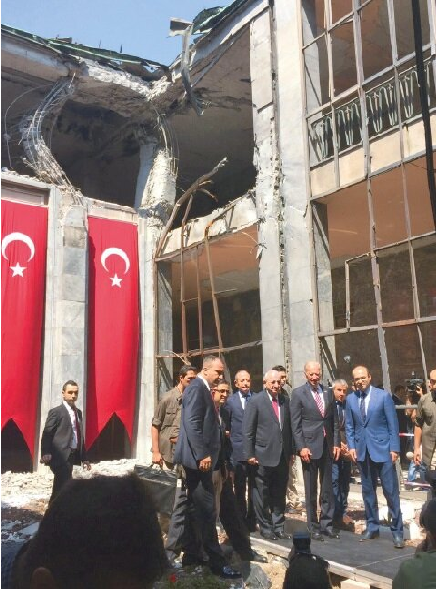
AK Parti teşkilatları SMS yoluyla uyarılırken, camilerden ezan ve salalar okunmaya başlandı. Saat 02.30'u gösterdiğinde MİT Basın Danışmanı Nuh Yılmaz, "Darbe püskürtüldü" açıklamasını