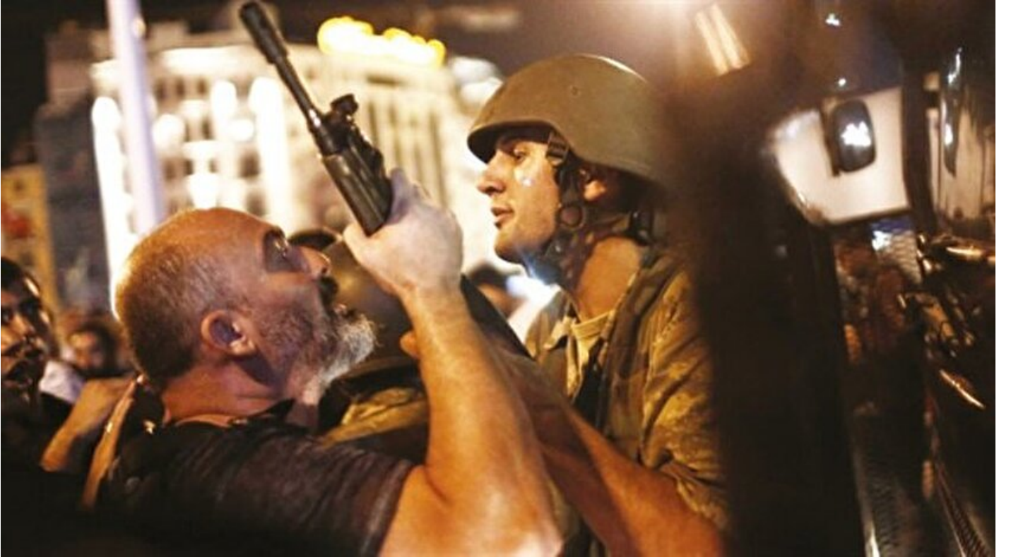
Zaferin mührü 16 Nisan'da vurulacak

Haber Merkezi · 15 Nisan 2017, 11:58 · Son Güncelleme: 15 Nisan 2017, 13:38 · Yeni Şafak