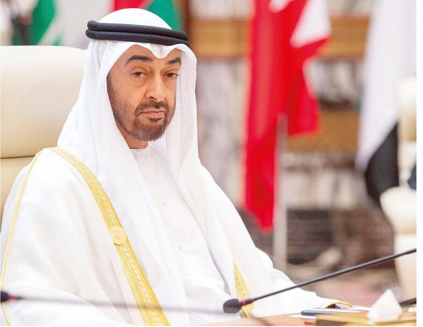
Muhammed bin Zayed

nükleer reaktörünün Abu Dabi'deki Baraka istasyonunda başarıyla devreye alındığını alenen duyuruyoruz. Uzmanlar nükleer yakıtı yüklemeyi, kapsamlı testleri yapmayı ve devreye alma işlemini başarıyla tamamladı" diye yazdı. Maktum, nükleer santrallerin ve BAE'nin yürüttüğü uzay araştırmalarının, 'Arapların bilimdeki yollarını yeniden yakalama ve diğer büyük uluslarla rekabet etme yeteneğine sahip olduklarına dair dünyaya bir mesaj olduğunu' savundu.