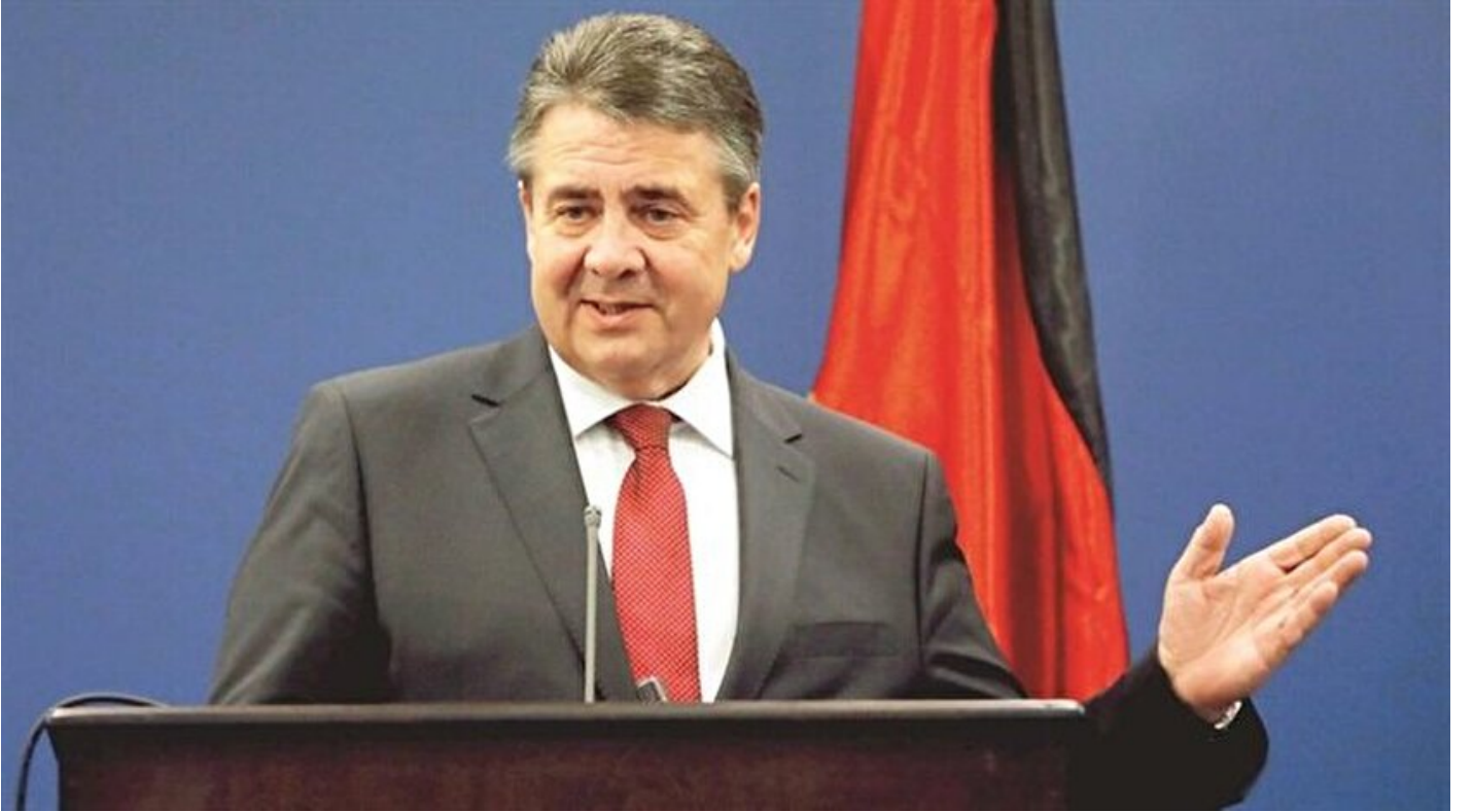
Almanya Dışişleri Bakanı Sigmar Gabriel