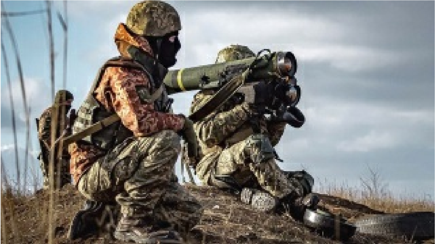
İsveç'ten Ukrayna'ya 'kural dışı' askeri yardım