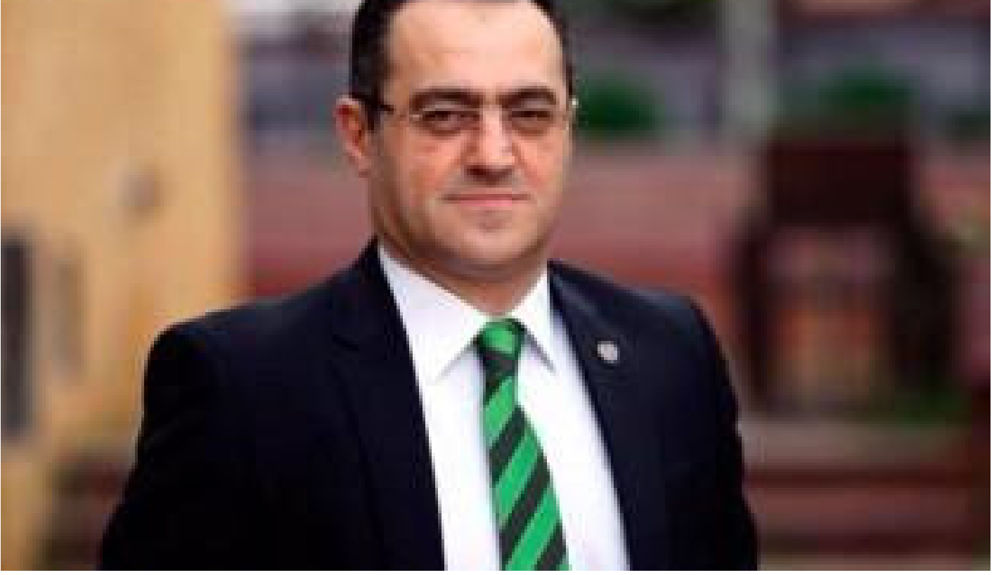
Rusya Devlet Başkanlığı Akademisi yetkilisi Talat Enveroviç Çetin