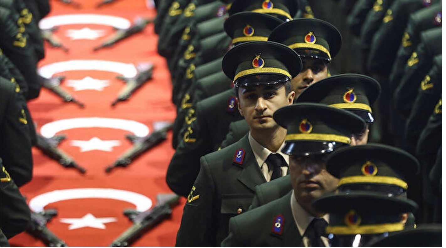
Yemin törenindeki askerler.

Sertaç Aksan · 27 Mayıs 2019, 12:00 · Son Güncelleme: 27 Mayıs 2019, 12:04 · Yeni Şafak