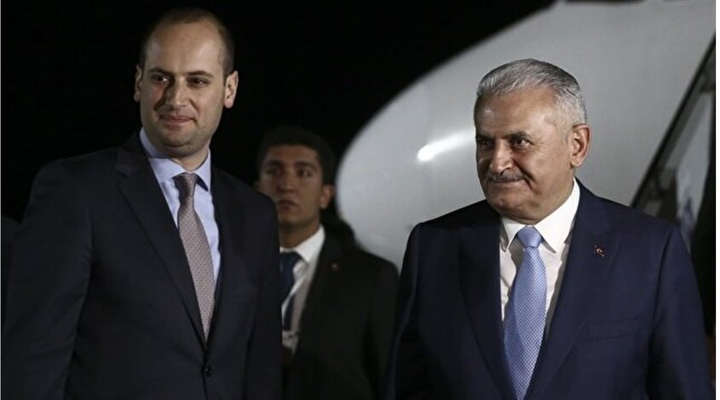
Başbakan Binali Yıldırım, Gürcistan'da

Haber Merkezi · 22 Mayıs 2017, 23:10 · Son Güncelleme: 23 Mayıs 2017, 00:30 · AA