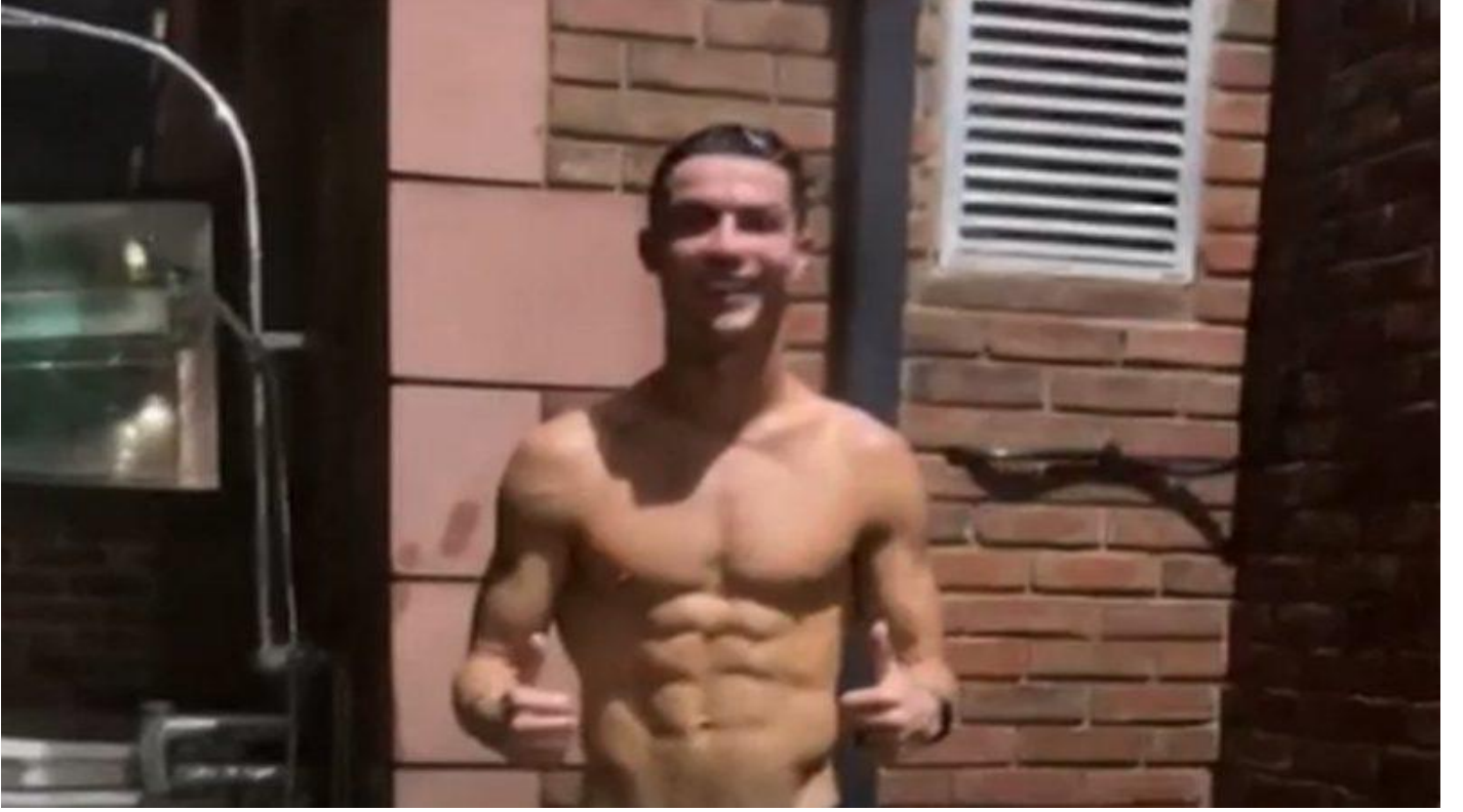
Ronaldo canlı yayında duş aldı, 1 milyon kişi izledi Sosyal Medya