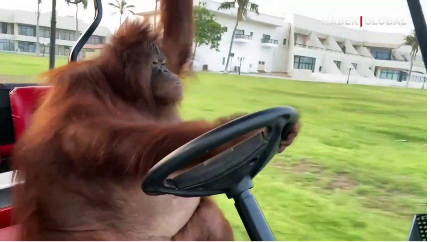
Herkes onu konuştu! Golf arabası süren orangutan sosyal medyayı salladı Sosyal Medya