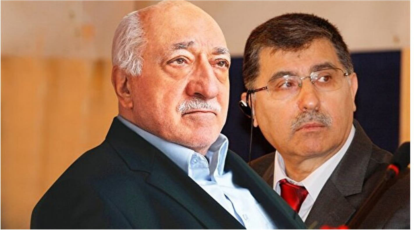
FETÖ elebaşı Fetullah Gülen ve Mustafa Özcan