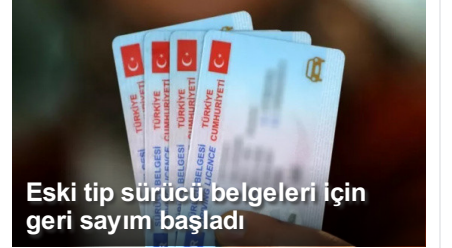
Eski tip sürücü belgeleri için geri sayım başladı