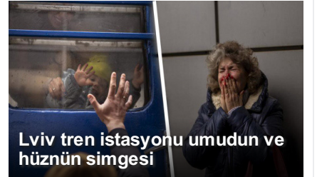
Lviv tren istasyonu umudun ve hüznün simgesi