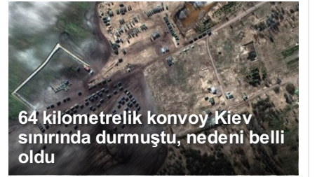
64 kilometrelik konvoy Kiev sınırında durmuştu, nedeni belli oldu