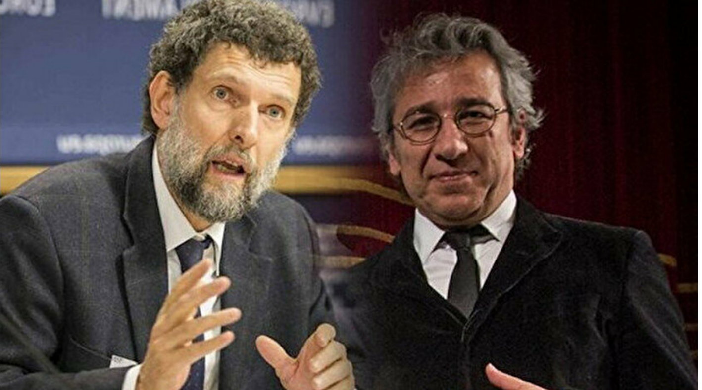
Osman Kavala- Can Dündar

Mustafa Sait Özkan · 20 Şubat 2020, 04:00 · Son Güncelleme: 20 Şubat 2020, 04:02 · Yeni Şafak