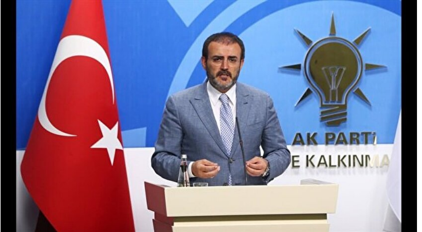
AK Parti Sözcüsü Mahir Ünal

Haber Merkezi · 28 Mart 2018, 12:00 · Son Güncelleme: 28 Mart 2018, 12:03 · Diğer