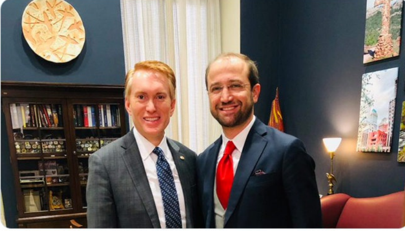
Sen. James Lankford

Good meeting @SenatorLankford on the #Hill today; enjoyed his company and the meeting — he's so smart and knowledgeable on foreign affairs!!!