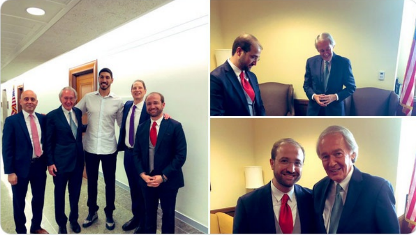
Ron Wyden ve diğer 3 kişi

Nice getting to know @SenMarkey today — and thanks to @RonWyden for the intro with him and hospitality at his office 🙏🙏