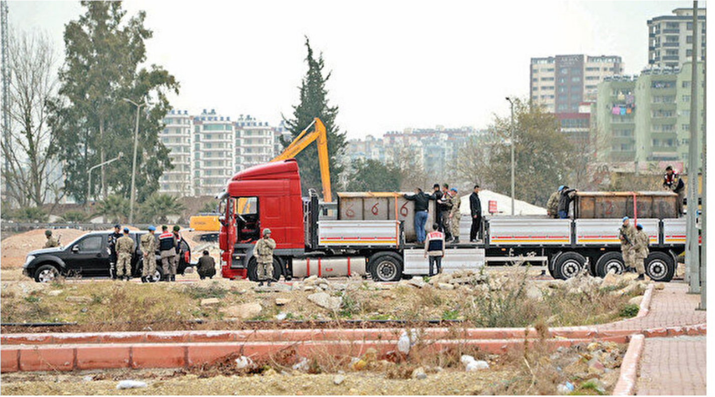
Vatana ihanette MİT TIR'ları perdesi

Haber Merkezi · 03 Mayıs 2019, 15:48 · Son Güncelleme: 03 Mayıs 2019, 15:58 · Yeni Şafak