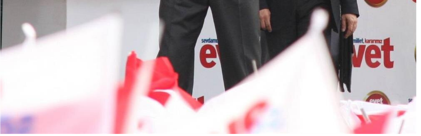
AK Parti Genel Başkanı Erdoğan, Bursa'da halka seslendi.