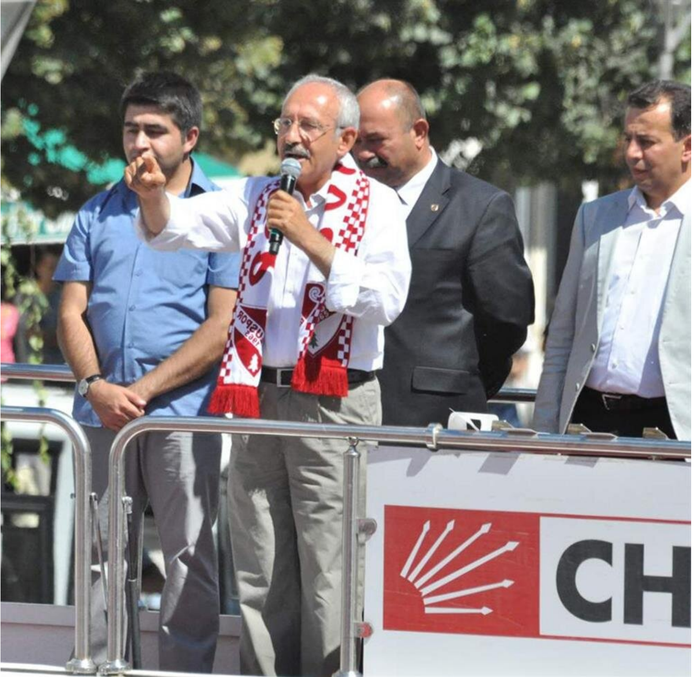
CHP Genel Başkanı Kemal Kılıçdaroğlu 'hayır' mitinginde.