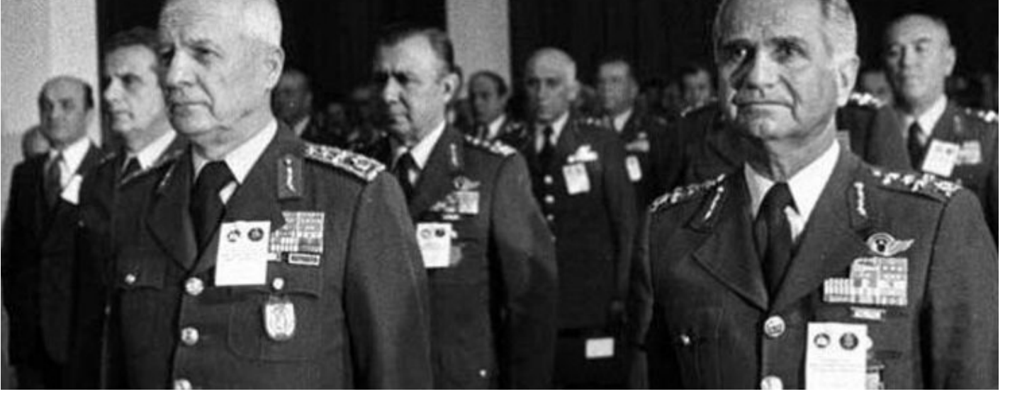
12 Eylül darbesinin mimarları Kenan Evren ve Tahsin Şahinkaya.

Türkiye Cumhuriyeti tarihinde silahlı kuvvetlerin yönetime üçüncü açık müdahalesi olan 12 Eylül Askeri Darbesi'nin üzerinden 36 yıl geçti. Darbecilerin yargılanması ise darbenin 30'uncu yılına denk gelen 12 Eylül 2010'daki referandumda "evet" çıkmasının ardından mümkün oldu.