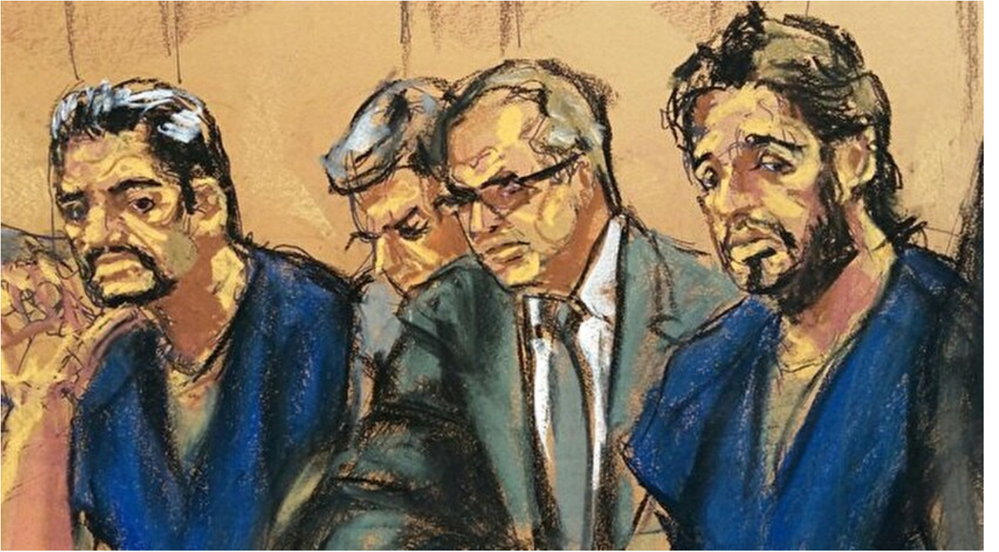
ABD'de görülen Rıza Zarrab davası