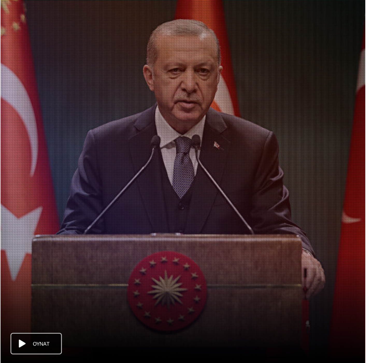
Cumhurbaşkanı Erdoğan: Ayasofya ile ilgili geçmişte yapılan bir yanlış bugün biz düzeltiyoruz

"Bu medeniyetin tarihine, kültürüne değerlerine doğrudan saldırmaya cesareti olmayanlar sembollerimizi yıpratarak sinsice kendilerine yol bulmaya çalışıyorlar. Hiç kimse merak etmesin Ayasofya'yı yeniden vakfiyesine uygun hale getirirken kültürel miras vasfını da ecdadın yaptığı gibi koruyacağız."