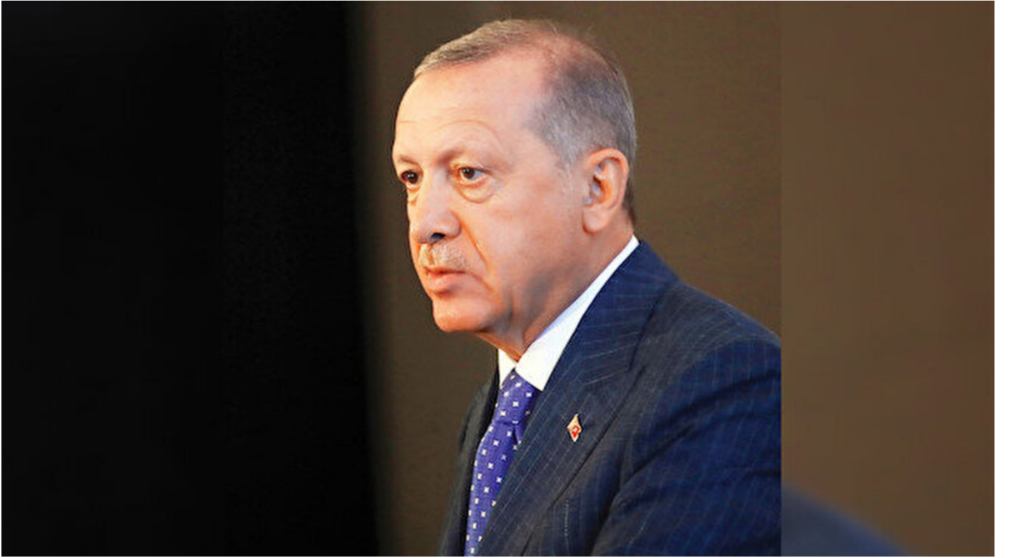
Recep Tayyip Erdoğan