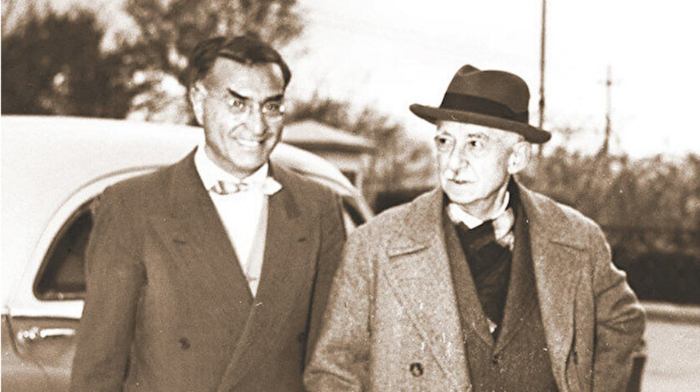
Kasım Gülek ve İsmet İnönü

Haber Merkezi · 20 Ocak 2020, 03:30 · Son Güncelleme: 20 Ocak 2020, 11:40 · Yeni Şafak