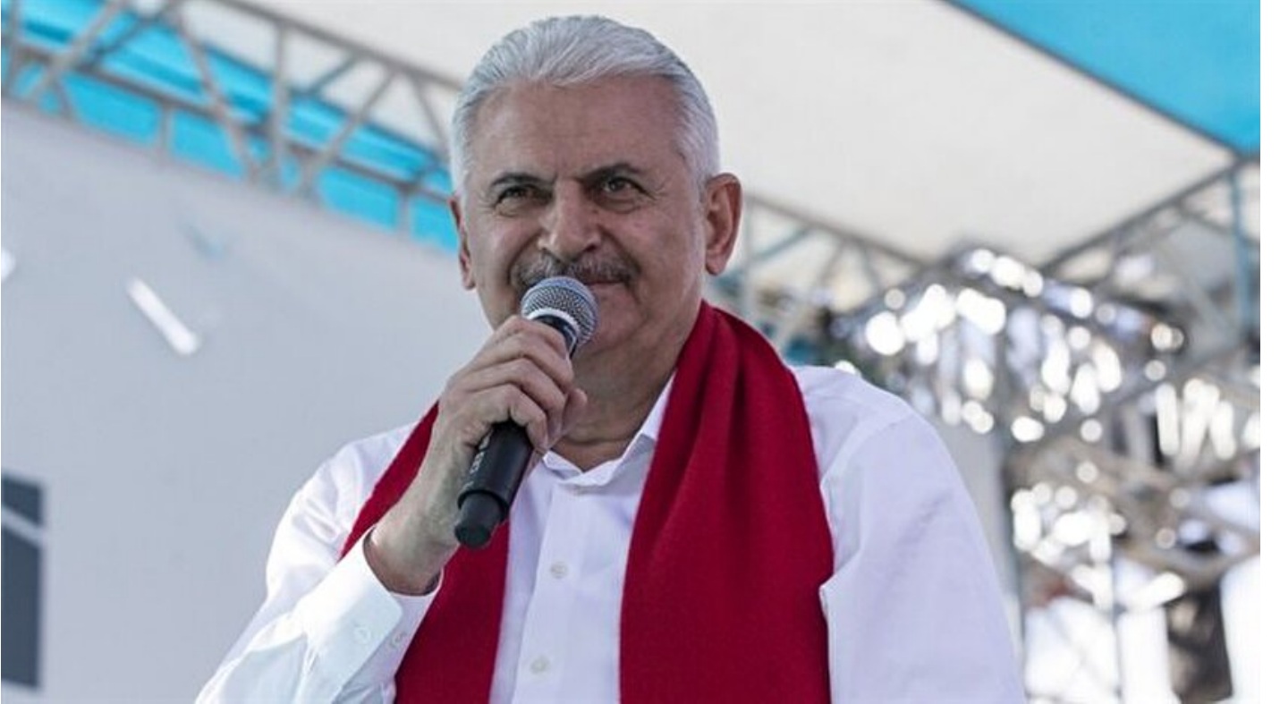
Başbakan Binali Yıldırım

Haber Merkezi · 12 Haziran 2018, 16:23 · Son Güncelleme: 12 Haziran 2018, 17:52 · AA