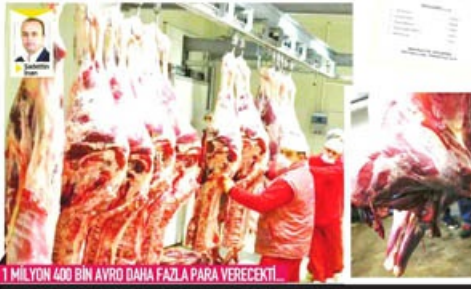
1 MİLYON 400 BİN AVRO DAHA FAZLA PARA VERECEK!

► 'GİZEMLİ İHALE' manşet haberimiz ile kamuoyunun dikkati et ihalesi ihalesinin çevresinde olmasaydı, Türkiye'nin Fıncı İhale ile yapılabilecek 10 bin ton et 1 milyon 400 bin Avro daha pahalıya ihale etmiş olacaktı. Manşet haberimiz, ESK'nın büyük bir yanlışın dinlendirilmesi, 1 milyon 400 bin Avro'nun da millet'in cebinde kalmasına vesile oldu. /13