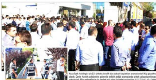
Koca İpek Holding'e ait 23 silâhla yasadışı silah satışı kapsamında aralarında 6 kişi bulunduğu bir grup, Çankırı Kocaeli polisliğinde güvenlik birliği operasyonunda yakılan silahları sergiledi. Bu silahların da bundan önce birisi devletin teyakküpleri.

■ BATILI ajansların "flaş haber" olarak duyurduğu operasyonun şehit cenazesinde gösterilen tepkiler, Seçim Hükümeti'ne yapılan eleştiriler ve ekonomideki kötü gelişer sebebiyle kâsiye slogan hükümetin gündem değiştirme çabası olduğu ileri sürüldü.