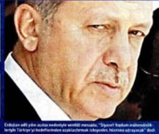
Erdoğan'ın eşiyle birlikte medya operasyonuna yönelik mesajla, "Şüpheli faaliyetler önlenmektedir" diyerek Türkiye'yi hedeflerine ulaşmalarını istiyorlar. İktidara sığınacak" dedi.

İktidarın yolsuzluk ve hukuksuzluklarını yazan medya kuruluşlarına operasyon için kurulan hükümet, icraata başladı. Bugün ve KanalTürk'ün de içinde olduğu Koza İpek Holding, dün sabah baskına uğradı