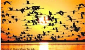
Yıldırım / Murat Öner / Zey AA

Kış aylarında buz marifetli, yıl mevsimlerinde beşaz görünen Tuz Gölü, kışın ve yazın kışın da aynı. Gölün değişikliği mevsimlere göre değişmektedir. Akdeniz havzasındaki büyük flamingo kolonilerine en yakınları Tuz Gölü, bu forma diye de bilinen bu bölgede yazın en büyük koloniyi barındırır. 30 7'ye