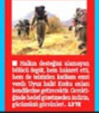
PKK, Qafar ile yedi Qafar, Bulaşıkla ve Zeytinlik ile 700 Alibek, Hıngir ve Bekir'in 40 binlerce yurtdışı üyesi, 10 binlerce yerel üyesi, 10 binlerce yerel üyesi...