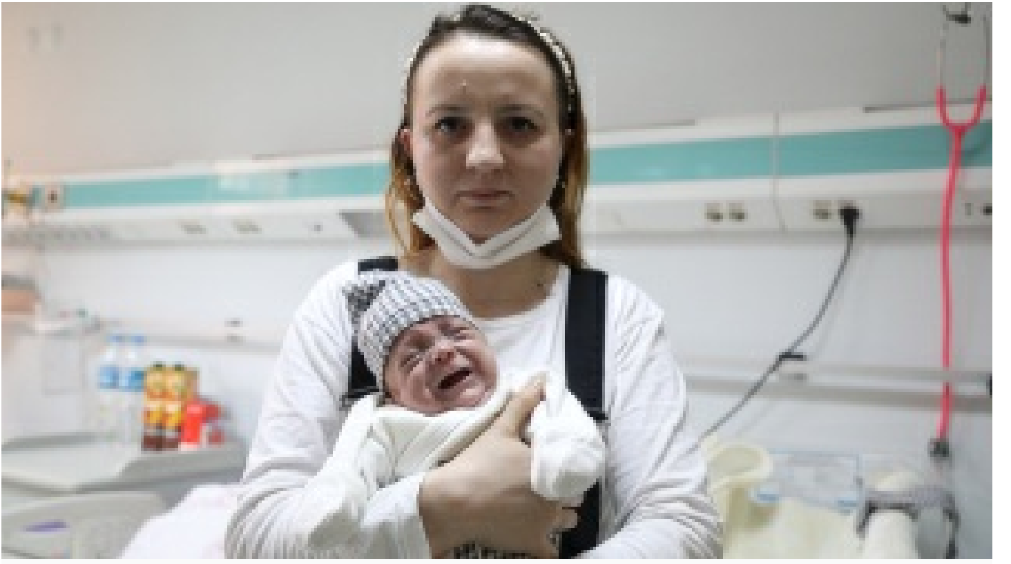
Hayata 600 gramla başladı