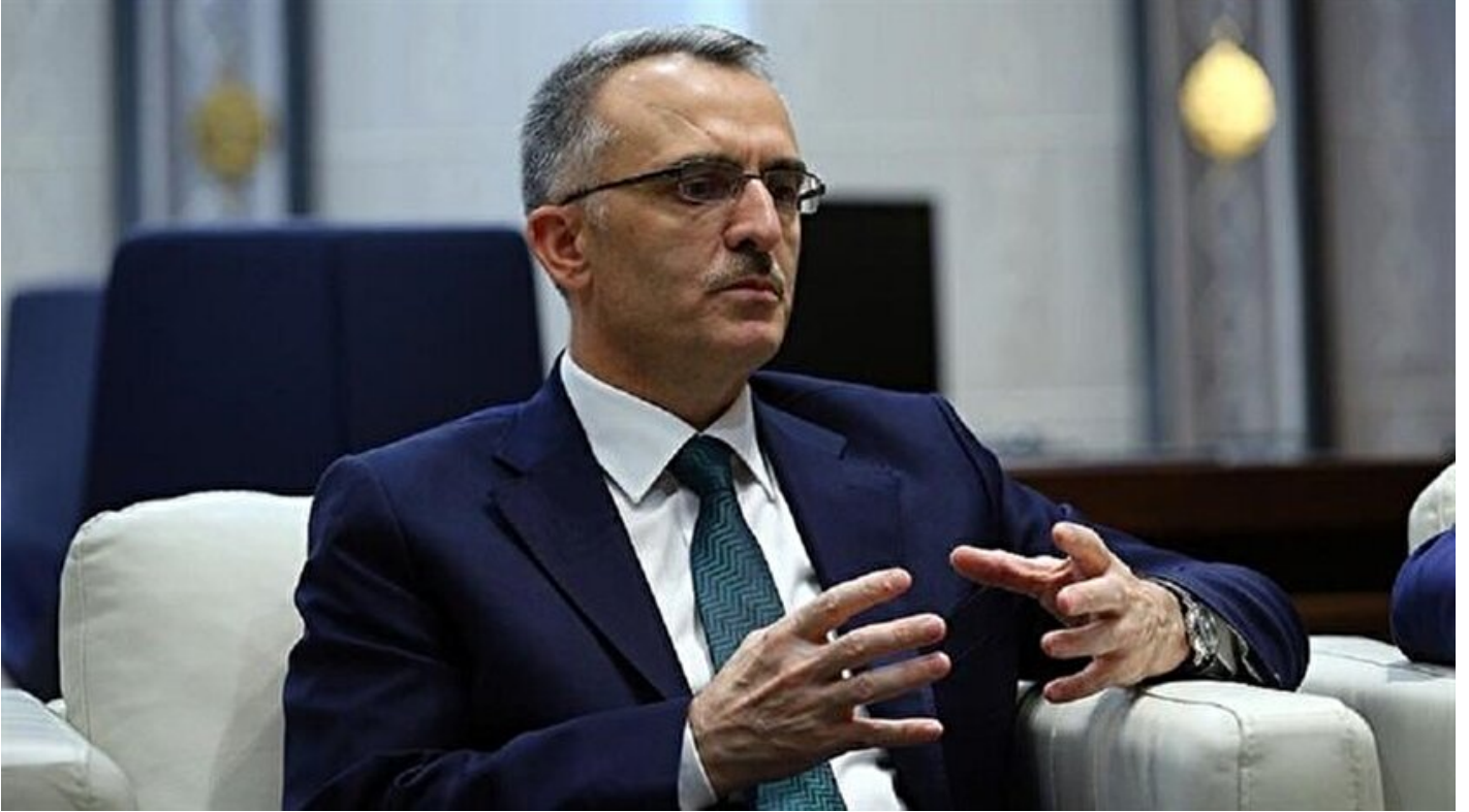
Maliye Bakanı Naci Ağbal

Haber Merkezi · 25 Eylül 2016, 15:34 · Son Güncelleme: 25 Eylül 2016, 15:53 · AA