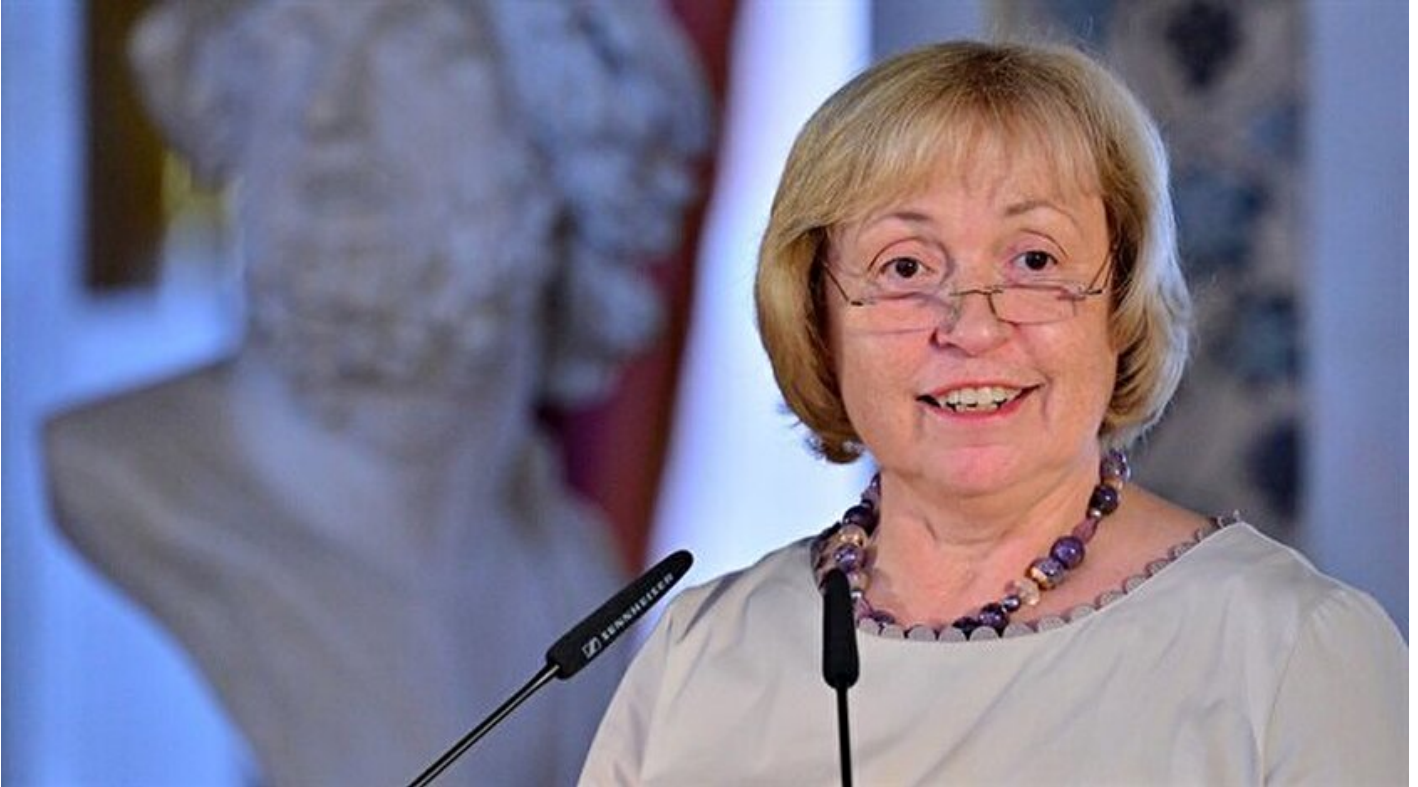
Almanya Federal Cumhuriyet Devlet Bakanı Böhmer

Haber Merkezi · 13 Kasım 2017, 19:56 · Son Güncelleme: 13 Kasım 2017, 20:26 · AA