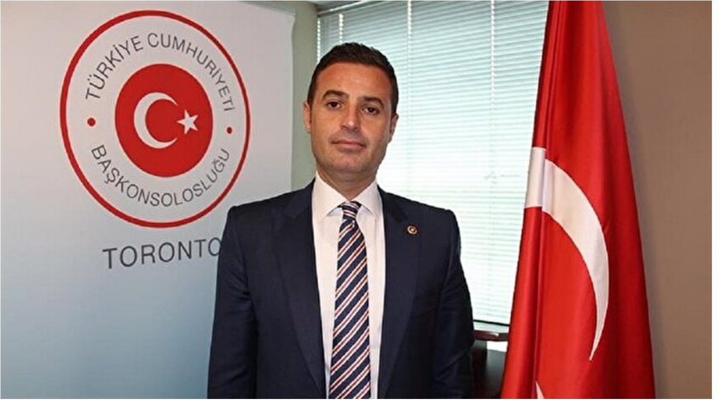
CHP Balıkesir Milletvekili Ahmet Akın