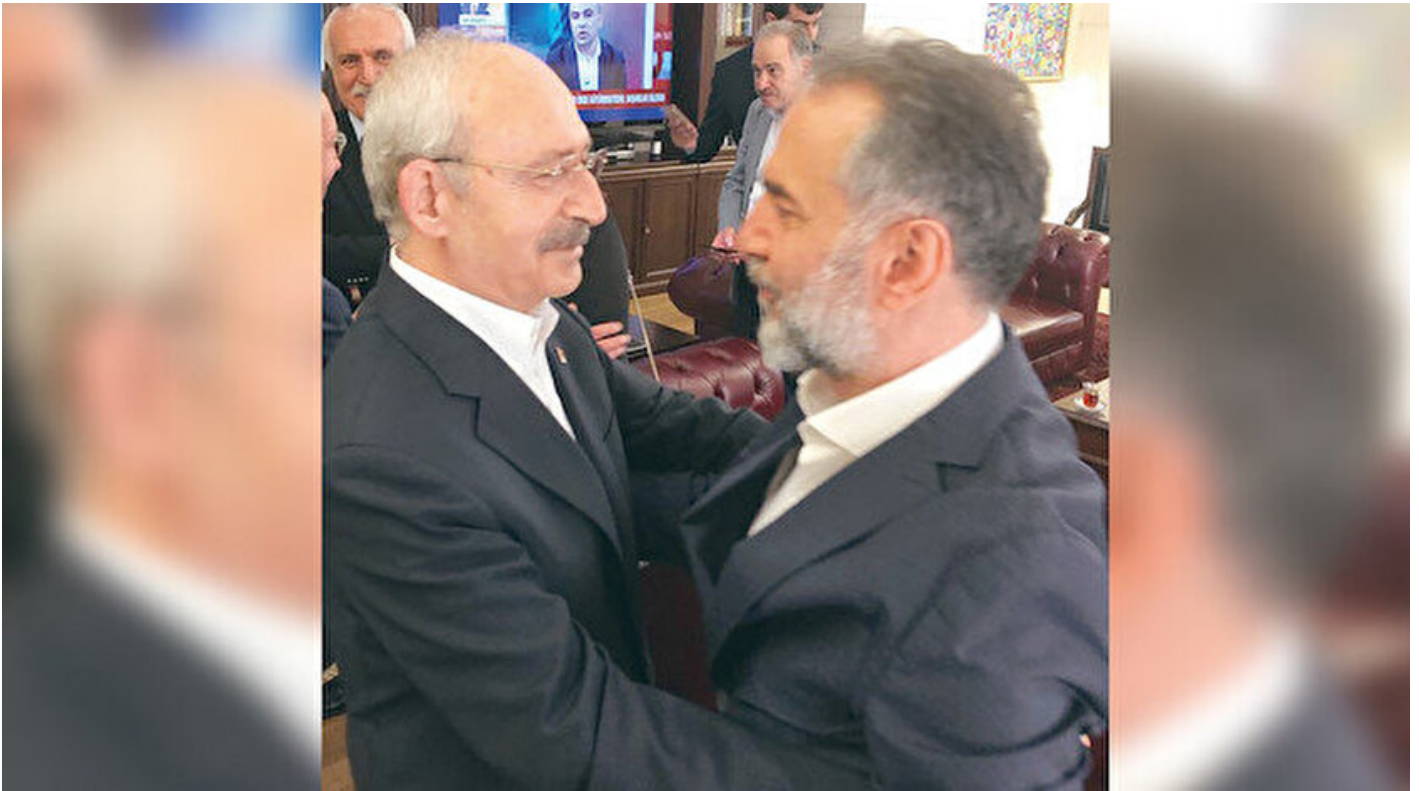
Kemal Kılıçdaroğlu ve Rasim Bölücek