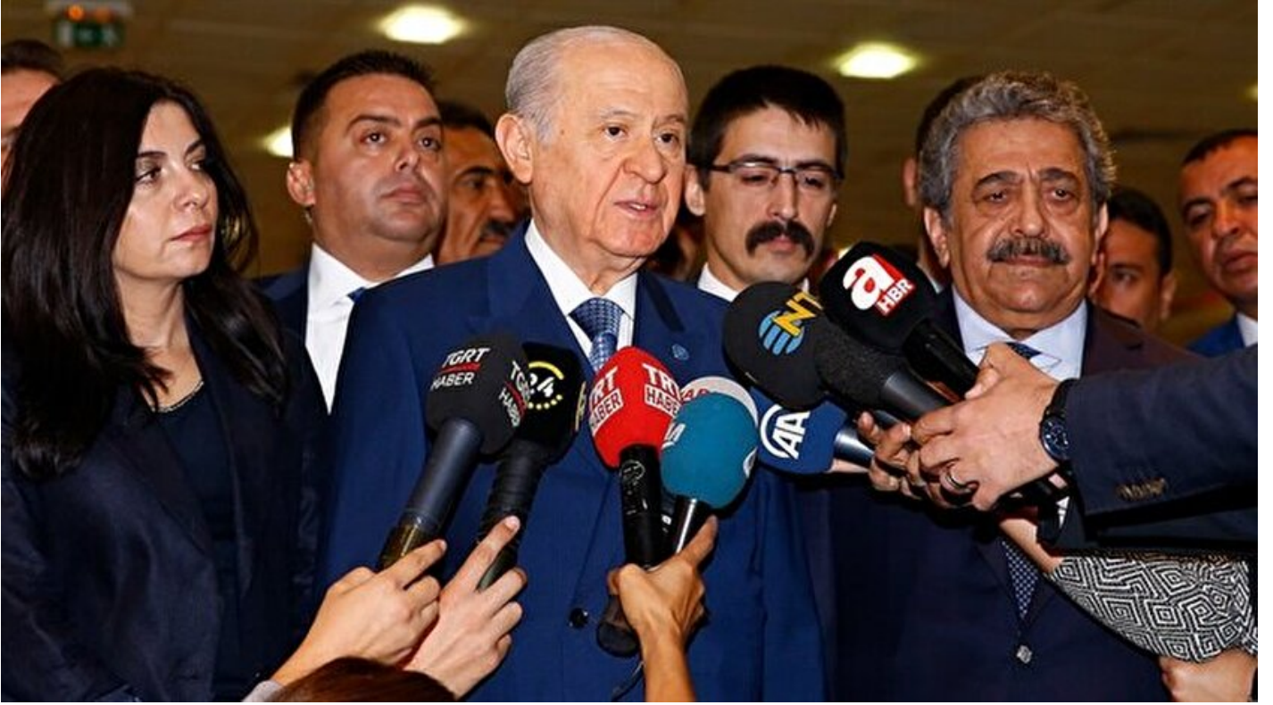
MHP Genel Başkanı Devlet Bahçeli

Haber Merkezi · 03 Mayıs 2018, 10:21 · Son Güncelleme: 03 Mayıs 2018, 11:30 · Tvnet