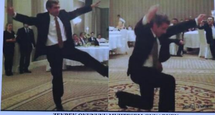
ZEYBEK OYUNUNU MUHTEŞEM OYNARKEN...

07.11.2017 - 19:27 || Son Güncelleme : 07.11.2017 - 19:27