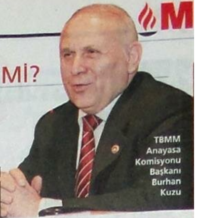
TBMM Anayasa Komisyonu Başkanı Burhan Kuzu

TBMM Anayasa Komisyonu Başkanı Burhan Kuzu: Sağlıklı işleyecek tek model başkanlık sistemidir. Bu sistemin daha uygun olduğunu düşünüyorum. Ya yeni anayasa, ya da değişiklik