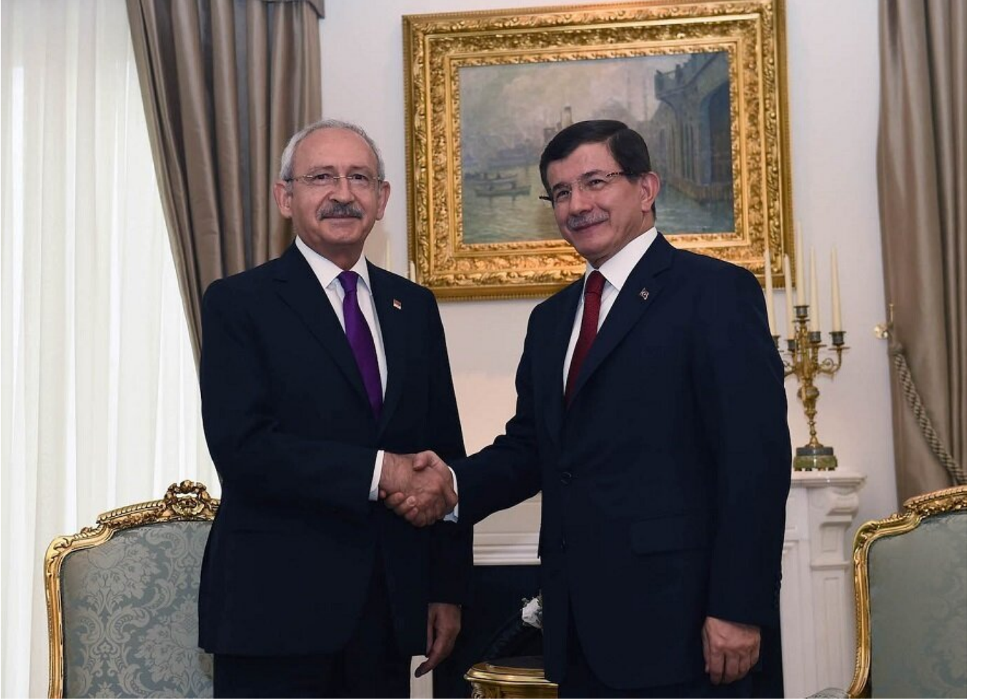
Dönemin Başbakanı Ahmet Davutoğlu, Anayasa görüşmeleri kapsamında CHP Genel Başkanı Kemal Kılıçdaroğlu ile görüştü.

yandan da yeni anayasa yapımı noktasında adımlar atmaya başladı. 1982 Anayasasının değiştirilmesi talebi bu dönemde de dillendirilirken, sistemin değişimi yönündeki tartışmalar yeniden gündeme geldi. Cumhurbaşkanlığı Sözcüsü İbrahim Kalın, sistem değişimi ile ilgili olarak "Başkanlık tartışması sistemi en etkin hale getirme meselesidir. Şahısla ilgili değildir. Bizim için en uygun model hangisi, milletimize tekrar sorulmak suretiyle bir karara varılacak. Sayın Cumhurbaşkanı'nın tavrı bellidir; başkanlık sistemi Türkiye'ye lig atlatacak. Böyle önemli bir tartışma millettten bağımsız, millettten ayrı düşünülemez. Bunun kapsamı referandumsa referanduma gidilir" açıklamasında bulundu.