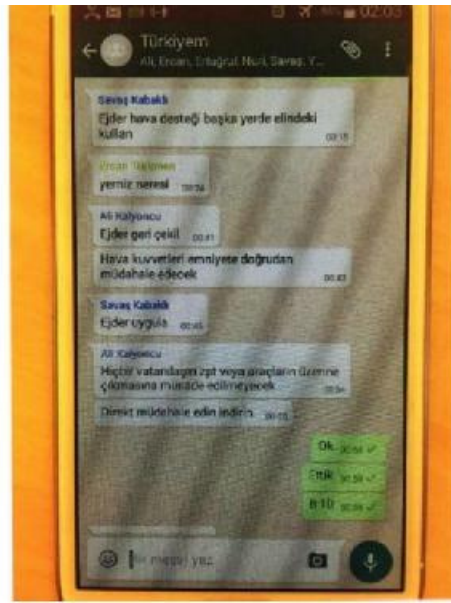
İddianamede, şüphelilerin grup