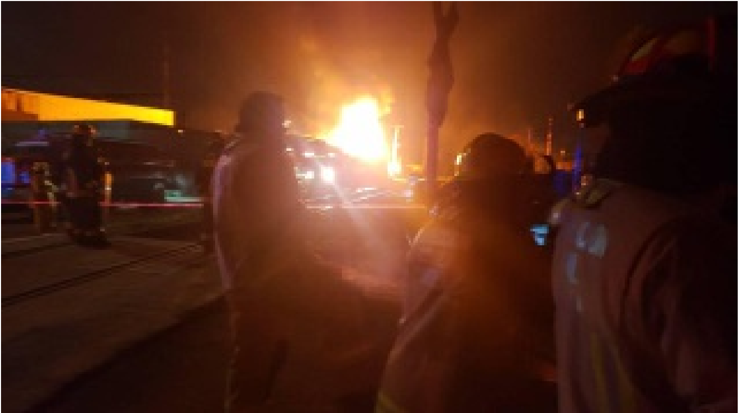
Dolmabahçe Sarayı'nda yangın!