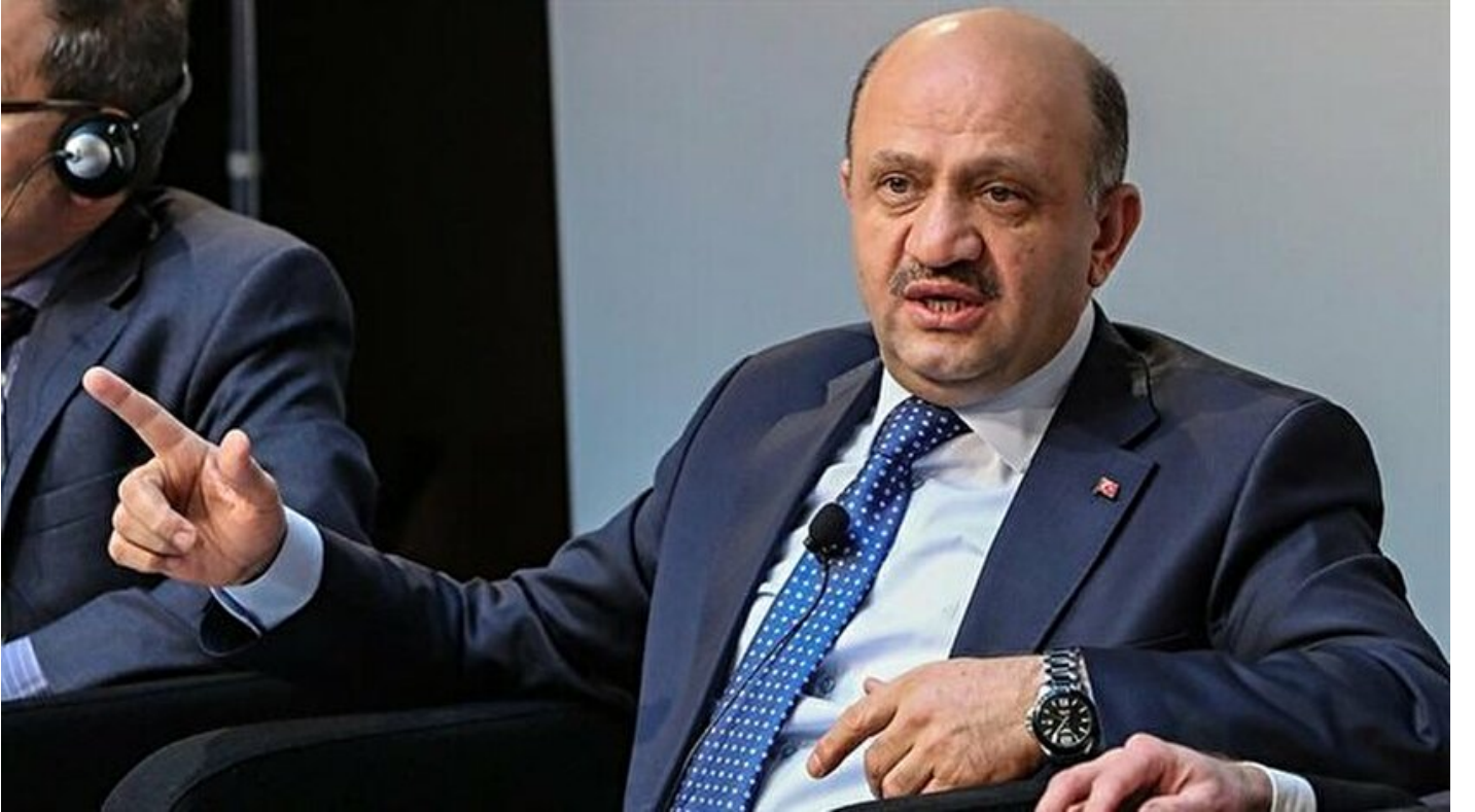
Milli Savunma Bakanı Fikri Işık.

Haber Merkezi · 18 Şubat 2017, 08:26 · Son Güncelleme: 18 Şubat 2017, 08:27 · AA