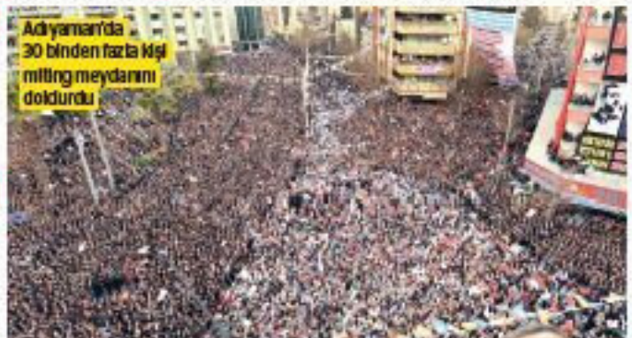
Adaylarımızda 30 binden fazla kişi miting meydanını doldurdu

DEVLET POLİTİKASIYLA TEMİZLİK ■ Başbakan Erdoğan, gazetesiyle aracından Ankara'da düzenlenen toplantıda konuşurken... HERKES PATIR PATIR AYRILACAK