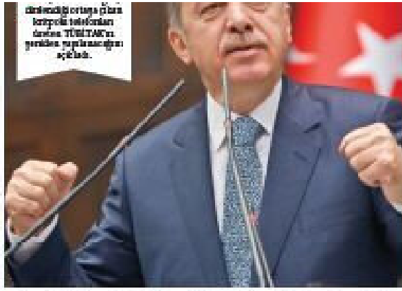
Alçakça montajı ortaya çıkaran kriptolu telefonların durumu TÜRKİYE'ye açıkladı.

■ Başbakan Erdoğan'ın, Türkiye Cumhuriyeti'nin en büyük lideri olduğunu söyleyerek, "Bu liderin ölümü, Türkiye Cumhuriyeti'nin en büyük kaybıdır. Bu liderin ölümü, Türkiye Cumhuriyeti'nin en büyük kaybıdır. Bu liderin ölümü, Türkiye Cumhuriyeti'nin en büyük kaybıdır."