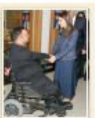
Başbakan Erdoğan'ın emilniñ karur emilniñler yapıldı. ÇİFTLİĞİN emilniñ karur emilniñler yapıldı.

■ Perşembe günü Şefkat Tepe'de düzenlenen toplantıda... 65 yaşa ücretsiz ulaşım