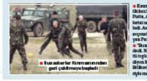
■ Rus askerler Kırım anarından gurtulmaya başladılar

■ Kırım krizinde arka plan... ABD'ye Dolun vurunuz