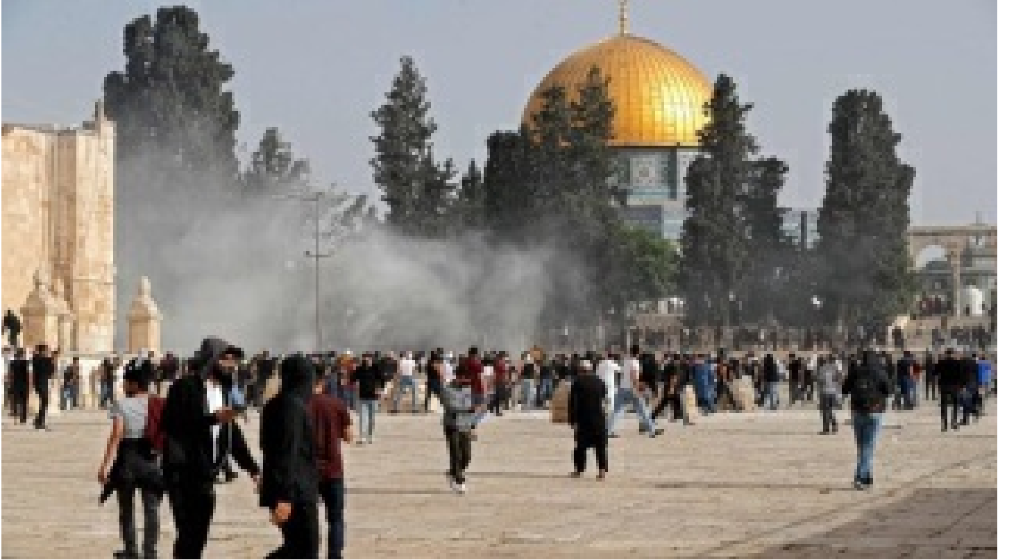
'Medeni Batı' suskun: Kudüs'te İsrail saldırganlığı artıyor