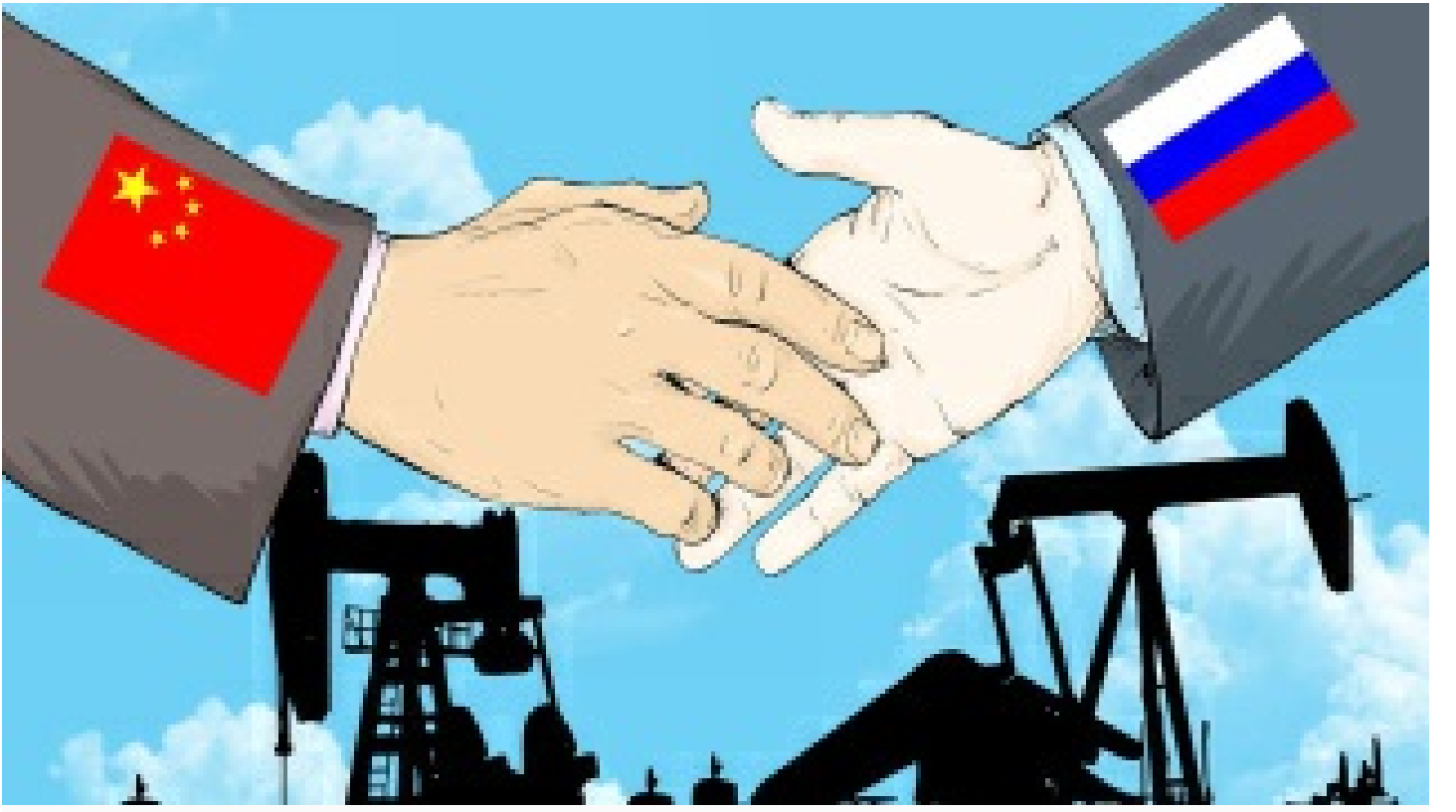
İmzalar atıldı: Kuzey Akım-2 kapasitesinde yeni boru hattı