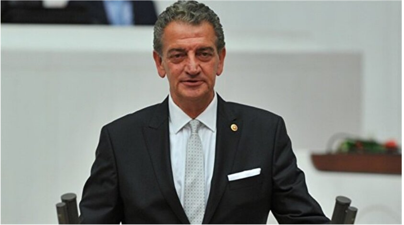
CHP Konya Milletvekili Hüsnü Bozkurt