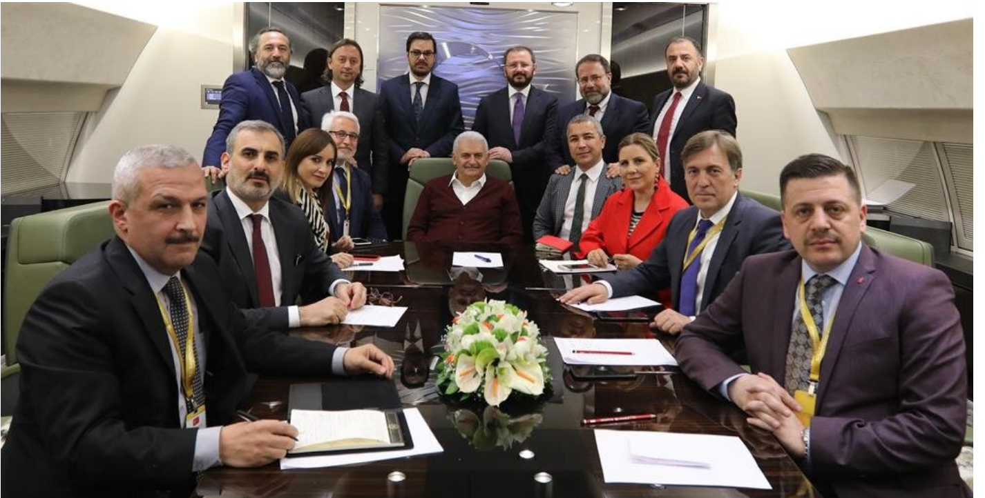
Başbakan Yıldırım, İspanya dönüşünde gazetecilerin sorularını yanıtladı.

Arkadaşlar, seçim takvimi belli oldu. Seçim havasına girilince tabii trafik yoğunluğu artar. Herkes, ben de buradayım, beni de unutmayın mesajını veriyor. Bunu yadırgamamak lazım. Seçim öncesi bu tip şeyler olabilir. Başka partilerin ne yaptığını, ne ettiğini biz üzerinde durmanın çok gerekli olmadığını düşünüyoruz. Biz kendi işimize bakalım. Biz seçime en iyi şekilde hazırlanacağız.