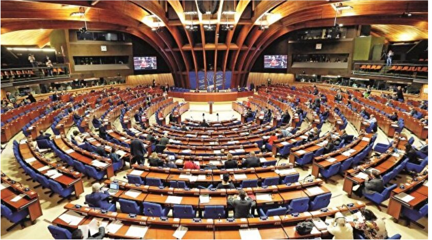
Avrupa Konseyi Parlamenterler Meclisi