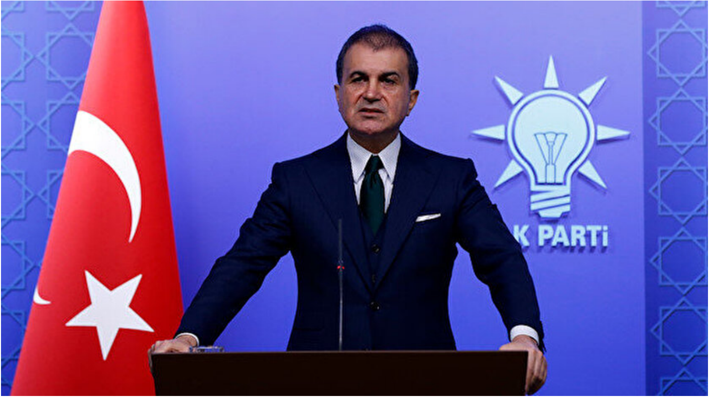
AK Parti Sözcüsü Ömer Çelik.