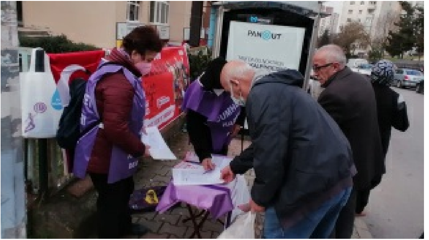
6 Mart'ta Tandoğan'da buluşuyoruz! Üretici kadınlar en önde