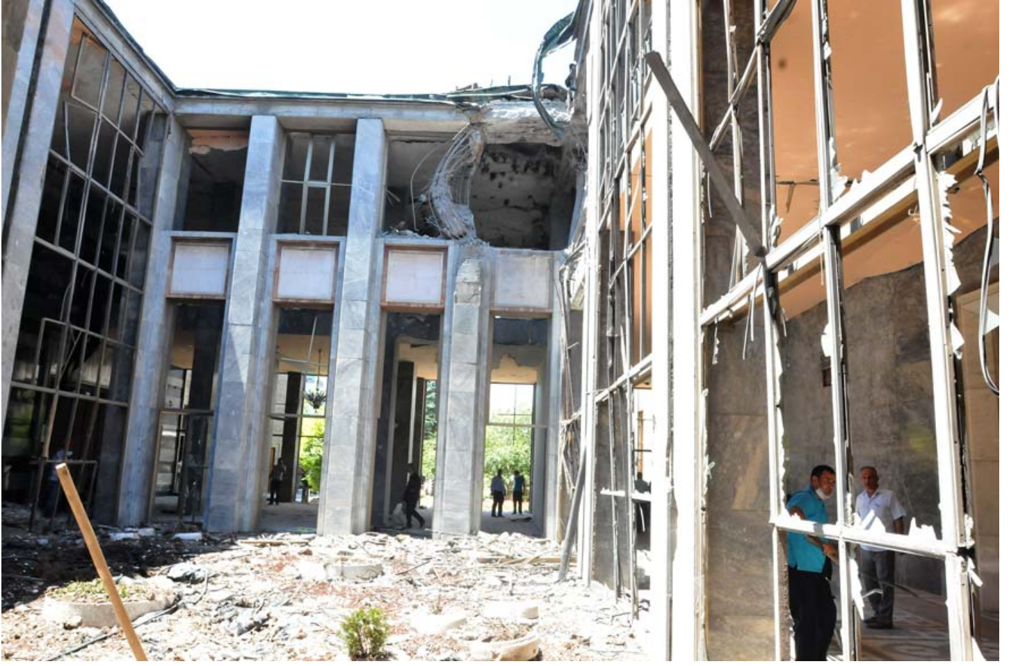
Türkiye Büyük Millet Meclisi gece boyunca bombalandı. Atılan bombaların Meclis'e verdiği büyük zarar günün aydınlanmasıyla gözler önüne serildi. Atılan bombaların Başbakan Binali Yıldırım 'ın odasına da büyük zarar verdiği görüldü.

Türkiye Barolar Birliği Başkanı Metin Feyzioğlu da terör örgütünün verdiği zararları gidermek için üzerlerine düşen görevi fazlasıyla yapmaya hazır olduklarını ifade etti. Feyzioğlu, "Hain darbe girişimi başarılı olsaydı Türkiye'de ne adliye, ne adalet, ne de biz vardık" dedi.