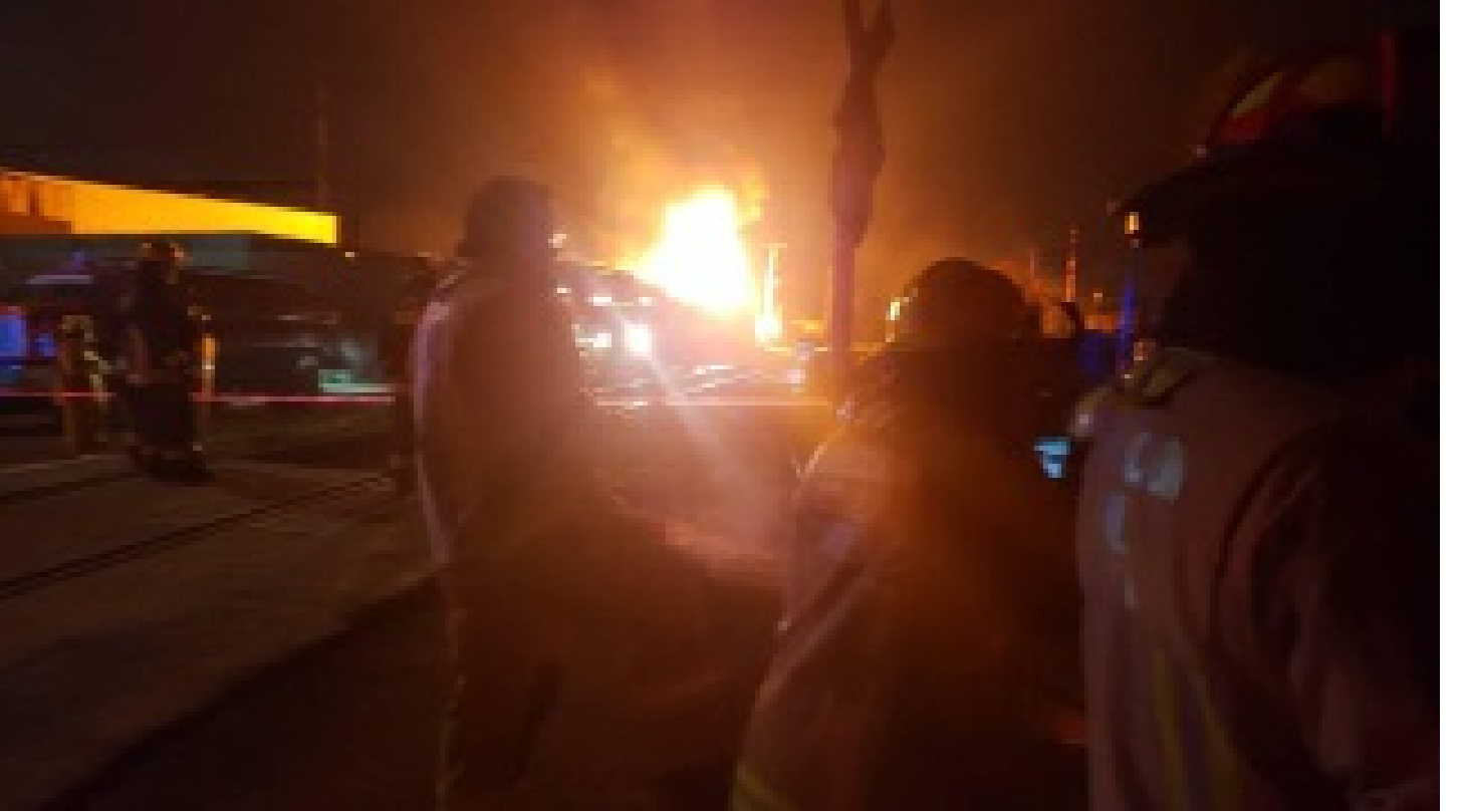
Dolmabahe Sarayı'nda yangın!