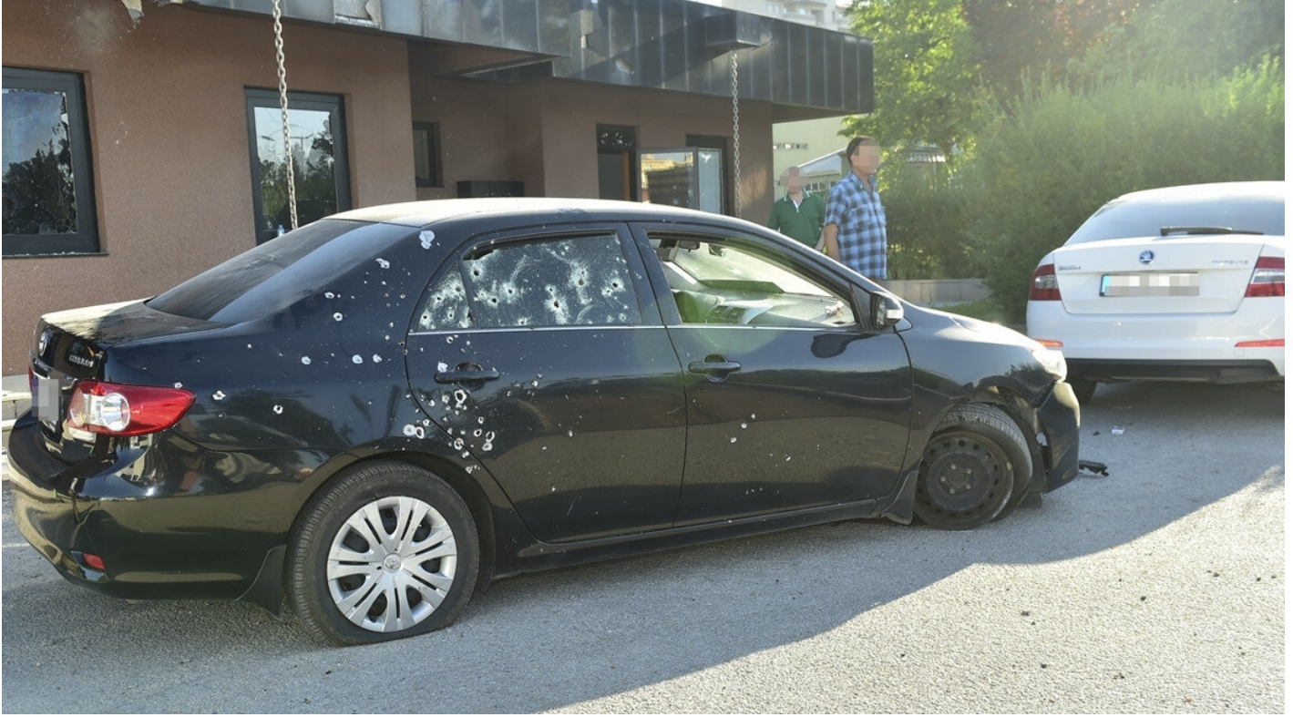
15 Temmuz'da FETÖ'cü hainlerin saldırdığı MİT içerisinde yer alan bir araç.

Bu doğrultuda ihbarlardan 6 bini işleme alınarak ilgili güvenlik birimleriyle paylaşıldı ve operasyona dönüştürüldü. Bu sayede, FETÖ/PDY içindeki kripto bazı isimler tespit edilerek haklarında adli süreç başlatılırken PKK ve DEAŞ'ın yurt içi ve yurt dışındaki yapılanmalarına ağır darbeler indirildi.