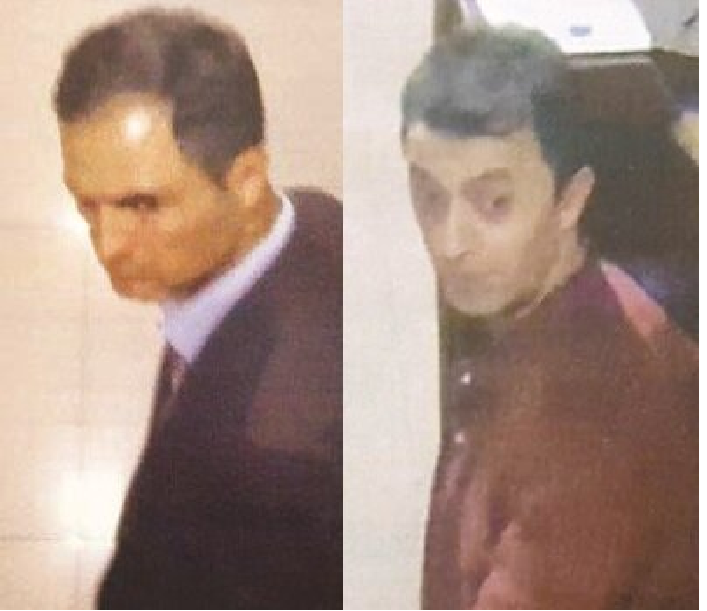
Genelkurmay 2. Başkanı'nın koruma astsubayı-Denizci Üsteğmen

giyimli olanların, o saatte mesaide olmamakla birlikte darbe girişimine katılmak üzere karargaha gelen askerler olduğu belirtildi.