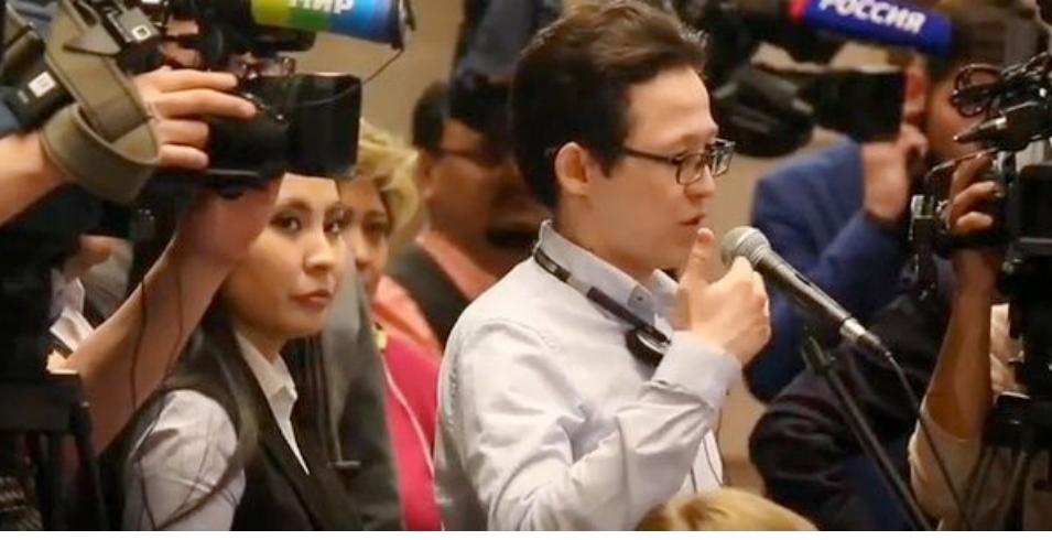
Sabah gazetesinde yer alan

habere göre Dışişleri Bakanı Mevlüt Çavuşoğlu'nun basın toplantısını sabote etmeyen çalışan Kazak kökenli bir gazetecinin fanatik bir FETÖ'cü olduğu belirlendi.